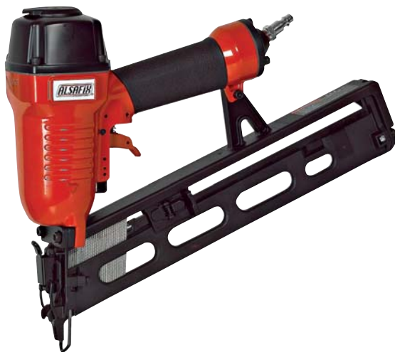
DA-64 P1 BR-64 P1